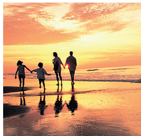
■ на прочее уйдет 5-10%.

Таким образом, довольно просто поехать в отпуск, если заранее составить некий бюджет: какую сумму вы примерно потратите по различным статьям расходов, а дальше останется придерживаться этой суммы.