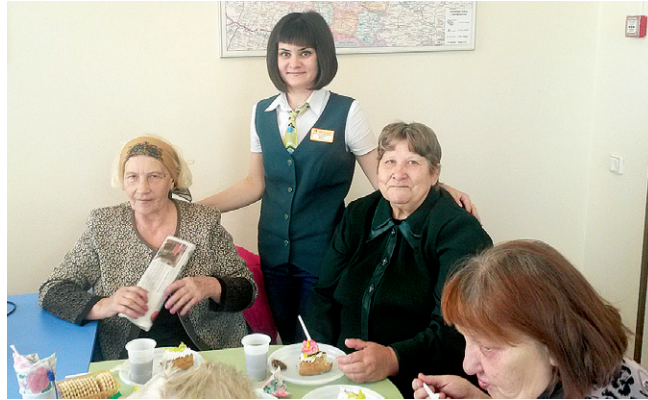
с. Большое Сорокино. Мастер-класс по изготовлению ваз из газет.

А для пайщиков дополнительного офиса с.Большое Сорокино специалисты провели мастер - класс по плетению ваз из газет. Где, за чашечкой горячего чая с конфетами и душевными разговорами о жизни, пайщики трудолюбиво осваивали интересное хобби. Обычные стопки газет очень быстро превратились в шедевры, которые будут радовать их не один год.