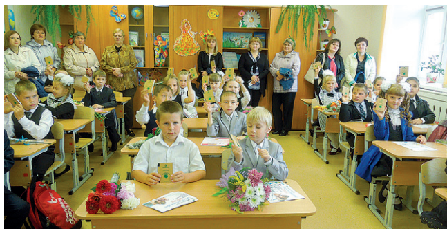
с. Исетское. Школа № 1, 3 класс.

не только дети, но и их родители. Школьникам рассказали, для каких целей делаются личные накопления, и есть ли от них польза. Ведь главное — это дать детям понимание необходимого в жизни минимума, чтобы во взрослой жизни оградить их от грубейших ошибок с деньгами.