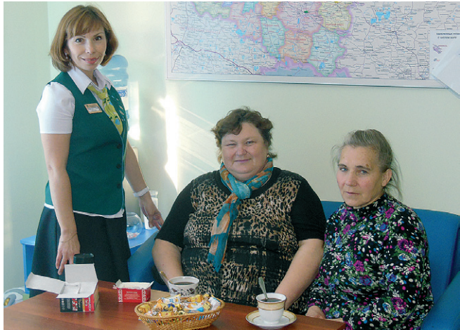
Г.Заводоуковск. Чаепитие с пайщиками.

1 октября в День пожилого человека во всех офисах КПК «Сибирский капитал» специалисты на протяжении всего дня поздравляли пайщиков-пенсионеров, вручали подарки, проводили мастер - классы и презентации.