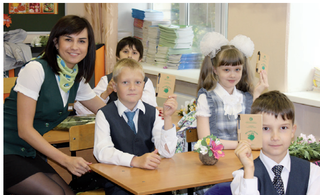
г. Тюмень. Школа №17, 3 класс.

В г. Тюкалинске урок финансовой грамотности провели в детской библиотеке. Активное участие в уроке принимали