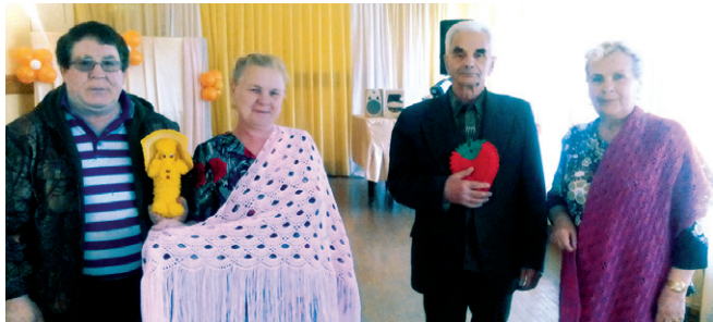
с.Исетское. Мастер - класс по вязанию.

Научиться вязать все желающие могли и в дополнительных офисах с.Исетское и с.Вагай. Под чутким руководством наших пайщиц-мастериц, все участники мероприятия освоили азы вязания. И кто сказал, что вязание женское дело?! Мужская половина наших пайщиков не оставалась в стороне и неплохо справлялась со спицами и нитками.