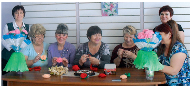
г.Тюкалинск. Мастер – класс по вязанию розочек.