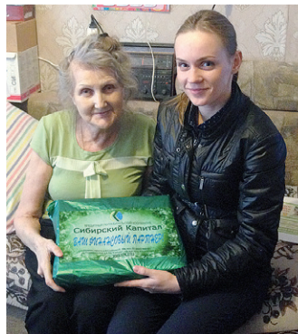
Г. Тюмень. Поздравление пожилых людей.

В основном офисе г.Тюмени для пайщиков кооператива специалисты провели презентацию об истории деятельности кооперативов в России и о достижениях КПК «Сибирский капитал» за пять лет. Пайщики с интересом слушали лекцию, после которой каждый из них получил памятный подарок от кооператива.