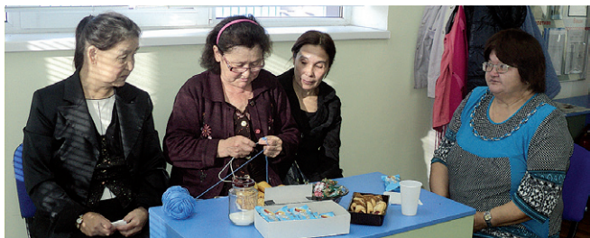
с.Вагай. Мастер-класс по вязанию.

А для пайщиков дополнительного офиса с.Большое Сорокино специалисты провели мастер - класс по плетению ваз из газет. Где, за чашечкой горячего чая с конфетами и душевными разговорами о жизни, пайщики трудолюбиво осваивали интересное хобби. Обычные стопки газет очень быстро превратились в шедевры, которые будут радовать их не один год.