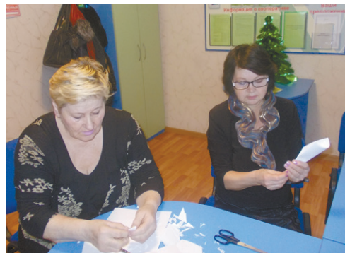
С. Нижняя Тавда

В свою очередь мы тоже поздравляем всех с Новым годом и Рождеством, желаем исполнения всех загаданных Вами желаний и семейного благополучия!