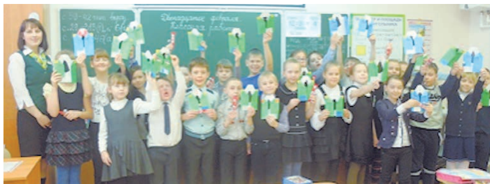
с. Исетское, СШО № 1, 3 класс

керамических чашек, которые после изготовления рукодельницы вручили своим дорогим мужчинам. А в с. Большое Сорокино пайщицы и их маленькие помощники создавали аппликации с военной тематикой, каждая из которых была адресована своему защитнику.