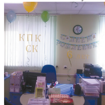
Дополнительный офис в г. Ишиме

От всей души поздравляем КПК «Сибирский капитал» с Днем рождения! Желаем успехов в сложной и ответственной работе, реализации намеченных программ. Пусть удача и вдохновение будут верными спутниками во всех начинаниях. Пусть индивидуальный подход к каждому клиенту остаются нашей визитной карточкой! Благополучия, дальнейшего процветания, настойчивости и терпения в решении задач!