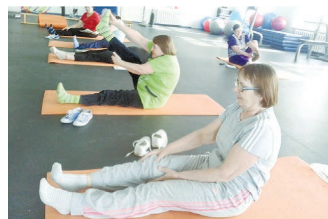
Дополнительный офис в р.п. Голышманово, хатха-йога на базе стадиона «Центральный»

После курса теории, группа приступила к изучению практики. Всего участникам преподали 16 упражнений, выполнение которых с первого раза давалось женщинам нелегко, но с правильной подачи инструктора всё прошло хорошо. Несколько участников даже всерьез заинтересовались йогой и решили встретиться через несколько месяцев, чтобы проверить результаты занятий и разучить новые комплексы упражнений.