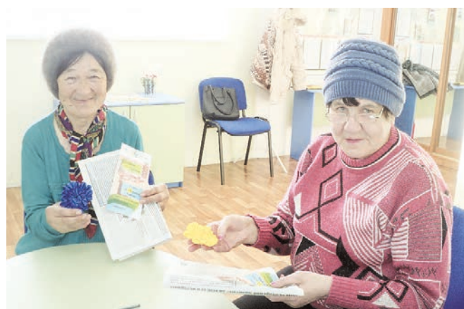
Дополнительный офис в с. Вагай

В дополнительном офисе с. Вагай пайщицы кооператива под руководством специалиста изготавливали цветы из атласных лент, которые можно использовать не только как брошь, но и как прекрасное украшение для штор. Собственноручно сделанные украшения пайщицы оставили себе на память о прошедшем мероприятии.