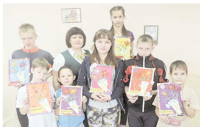
Дополнительный офис в г. Ишиме, АУ СОН ТО «СРЦН «Согласие»