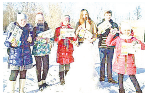
п. Боровский, воспитанники спортивного комплекса Боровский