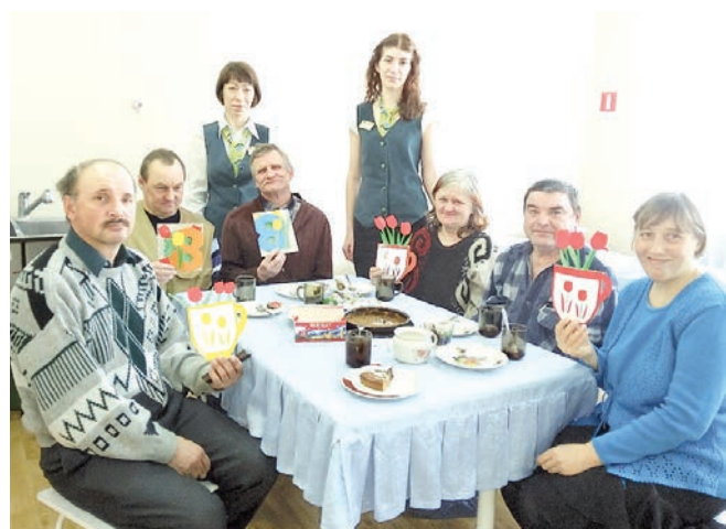
Специалисты дополнительного офиса в с. Абатское, КЦСОН «Милосердие»

В честь замечательного весеннего праздника - 8 Марта, в дополнительных офисах КПК «Сибирский капитал», специалисты проводили различные мастер-классы. Например, специалисты дополнительного офиса с. Абатское провели творческий мастер-класс по изготовлению праздничных открыток в КЦСОН «Милосердие». А в дополнительном офисе с. Б. Сорокино специалисты совместно с пайщиками кооператива создавали аппликации из цветной бумаги и бумажных салфеток под названием «Ваза с цветами».