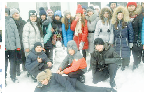
г. Ишим, ученики 6 «б» класса МАОУ СОШ № 5

на несколько команд, ребята с азартом устроили соревнование на скорость и креативность. Несмотря на то, что день выдался теплым, а снег был рыхлым, общими усилиями удалось изготовить три снеговика, а победителем стала крепкая дружба!