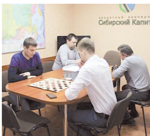
г. Тюмень, основной офис КПК «Сибирский капитал»

Изюминкой мероприятия стал формат его проведения - командные соревнования между мужчинами-сотрудниками кооператива. Армреслинг, турниры по настольным играм, а также проверка умственных способностей в игре «Ответь за пять секунд».