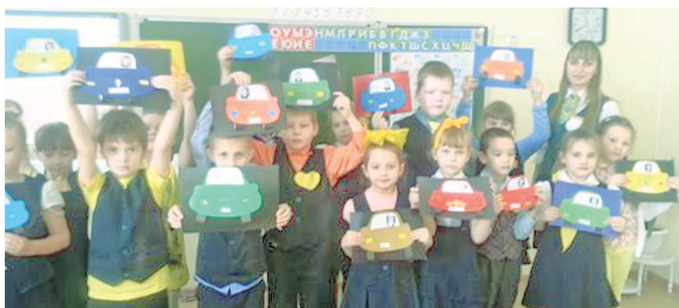
г. Ялуторовск, МАОУ «Средняя общеобразовательная школа № 3», 1 «б» класс

Основной офис КПК «Сибирский капитал» тоже не остался в стороне. Сплоченный коллектив и командный дух его членов - неотъемлемая часть того, от чего зависит успех деятельности любого предприятия. Ко Дню защитника Отечества в основном офисе КПК «Сибирский капитал» в г. Тюмени для мужской половины кооператива сотрудницы подготовили конкурсы и праздничный стол.