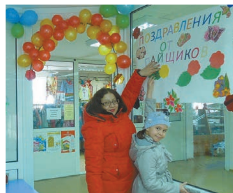
Дополнительный офис в с. Исетское

В честь праздника каждый из специалистов кооператива старательно украшал офис, поздравлял и угощал своих пайщиков, принимая ответные поздравления и душевные пожелания в адрес кооператива.