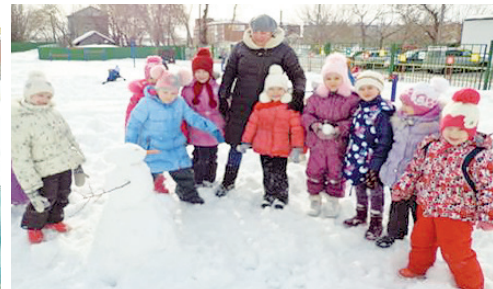
г. Ялуторовск, детский сад № 10

детского сада № 8 и в г. Ялуторовске дети из детского сада № 10 с радостью лепили снеговиков, конечно не без помощи воспитателя и специалиста кооператива, ведь даже вдесятером непросто положить друг на друга три тяжелых шара из снега. А в г. Ишиме участниками мероприятия стали ученики 6 «б» класса МАОУ СОШ № 5. Разделившись