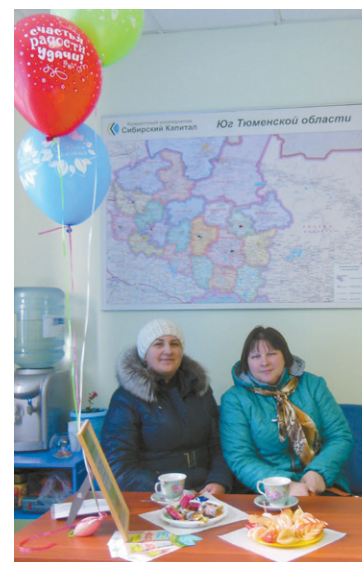
Дополнительный офис в г. Заводоуковске