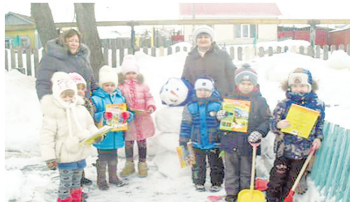
г. Тюкалинск, старшая группа детского сада № 8

детского сада № 8 и в г. Ялуторовске дети из детского сада № 10 с радостью лепили снеговиков, конечно не без помощи воспитателя и специалиста кооператива, ведь даже вдесятером непросто положить друг на друга три тяжелых шара из снега. А в г. Ишиме участниками мероприятия стали ученики 6 «б» класса МАОУ СОШ № 5. Разделившись